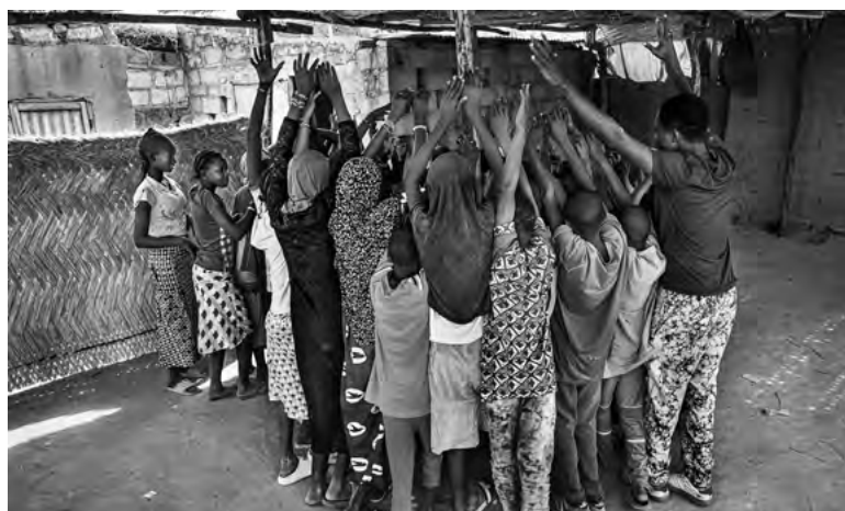
Les engagements de Sentinelles : soutenir les personnes déplacées à travers des aides d'urgence et des petits commerces, ainsi qu'accompagner les enfants.