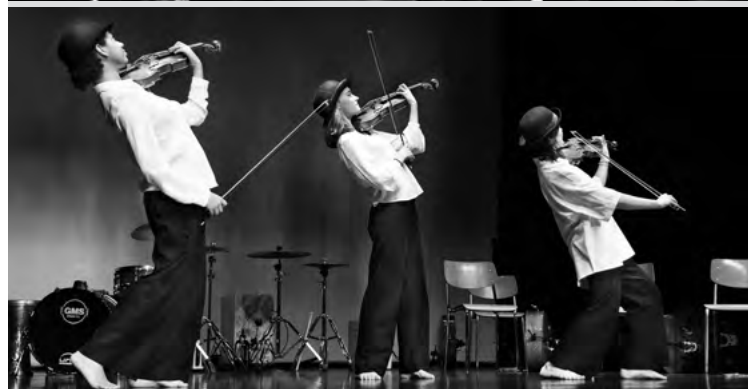
Un concert plein d'émotion avec les Ministrings, au service d'une belle cause.