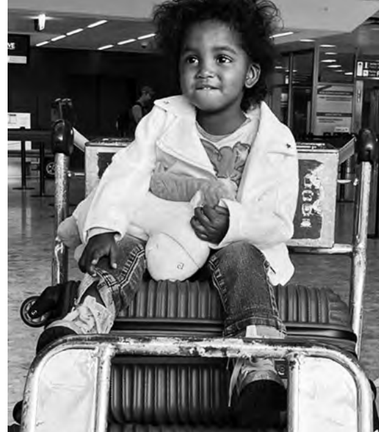
À l'aéroport de Genève, la fillette se réjouit de bientôt retrouver sa maman.

communication interventriculaire, un petit trou dans la paroi séparant les deux ventricules du cœur. Cette anomalie a entraîné un passage anormal du sang oxygéné, qui a conduit à des symptômes graves, tels que des difficultés respiratoires et un retard de croissance. À terme, elle pourrait souffrir d'une insuffisance cardiaque.