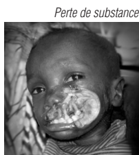
Perte de substance

Le principal traitement des séquelles est d'ordre chirurgical, en vue de rétablir une mobilité buccale, l'aspect esthétique et ainsi une meilleure acceptation sociale.